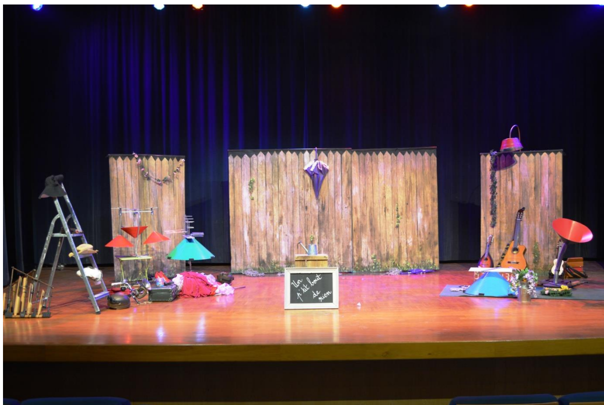
Prise de vue à la fin du spectacle